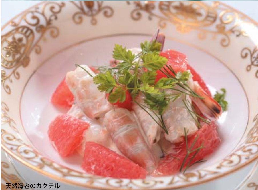
天然海老のカクテル