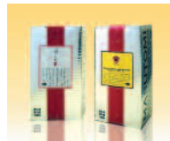
人と環境にやさしく美しい 可燃性の段ボール箱で宅配

私共の商品にとって美味しさと安全性の鍵を握るのは検査と鮮度です。そこではHACCP基準にそって品質検査した作りたての製品を、出荷から最短時間で皆様の食卓に届くようにすることです。そこで一般消費者向け市場においてさらに企業理念を推進していくため、人と環境にやさしく、かつ美味しく安全な作りたての鮮度を保つ「ショップ&クリック」という店舗とインターネットを組み合わせた新しい販売システムを開発（徳島県オンリーワン事業計画認定）しました。このシステムでは、流通過程での商品滞留時間と物流を短縮することで環境への負荷を軽減させ、さらに小売店など流通の販売に関わる不良在庫や廃棄処分などをなくします。流通では一般消費者向けに弊社のホームページへの情報を提供し誘導していただくことで手数料をお支払いするシステムですので、仕入れや在庫などの販売リスクをとまわず店外や時間外での手数料が獲得できます。新鮮で安全なうえ、24時間場所を問わず携帯電話・パソコン・FAXによる注文に対応し宅配する、多忙な方、高齢者、お身体の不自由な方など、外出が困難な方にとってやさしいシステムです。