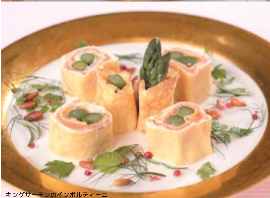
キングサーモンのインボルティーニ

海の幸をふんだんに使ったイタリアで人気の高いアンチパスト料理の中から、真中シェフオリジナルレシピによる