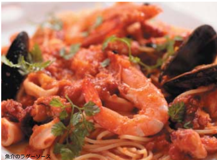
魚介のラグーソース