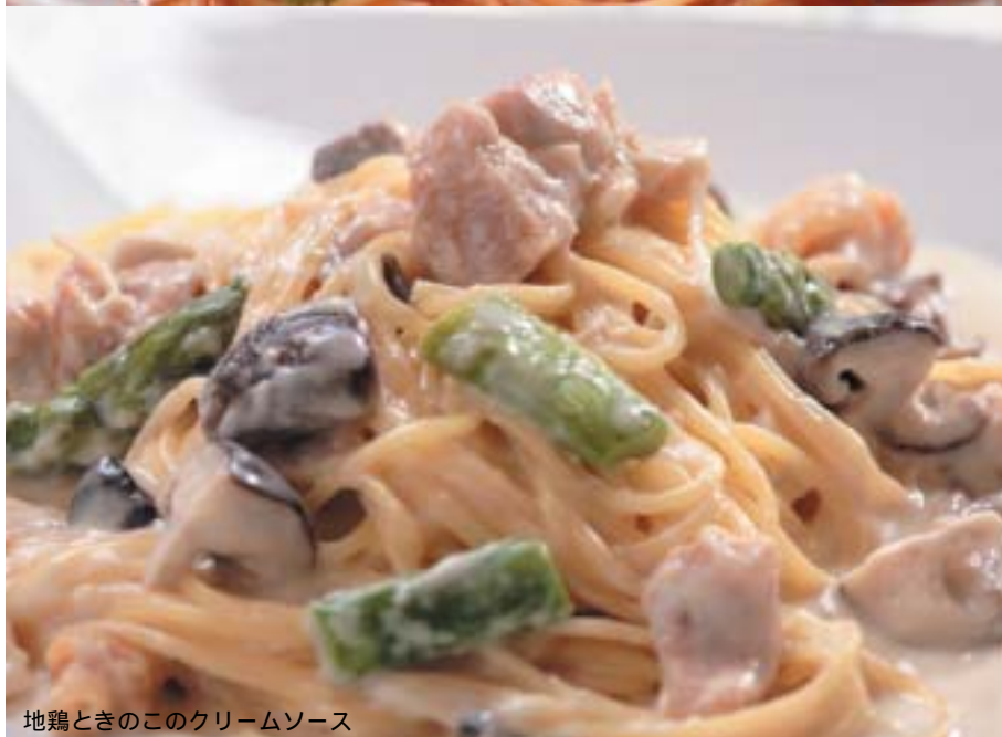
地鶏ときのこのクリームソース